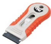
K-740-OR PeLa Orange オレンジ

日本初ポリカーボネートブレードを製造開発したカンザワオリジナルブレードを採用。ポリカーボネートブレードが素材を傷つけないので、ステンレス・冷蔵庫・木材・プラスチック・車のステッカー・ガラスなどに張られたシールはがし、汚れ落とし、ボードのWAX除去等に最適です。 替え刃式