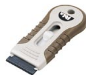
K-740-BR PeLa Brown ブラウン