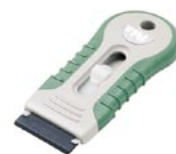
K-740-LG PeLa Light green ライトグリーン