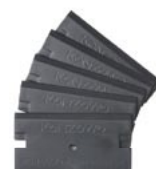
K-740-B PeLa PC Blade 替刃