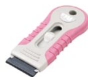
K-740-PK PeLa Pink ピンク