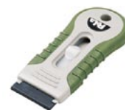
K-740-DG PeLa Dark green ダークグリーン