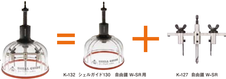
K-132 シェルガイド130 自由錐 W-SR用